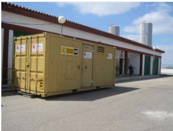
CASETA TALLER PORTATIL

se doto de los medios necesarios provisionales para reanudar el riego, e inició junto con su reparador de confianza las primeras tareas de reparación y sustitución de los bienes dañados.