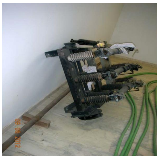
SECCIONADOR DESMONTADO PARA SU INSPECCIÓN

Un siniestro de estas características, siempre es largo ya que son muchas las circunstancias que intervienen y hay que prever la necesidad de liquidez para el Asegurado que tendrá de acuerdo con las certificaciones de obra que ir haciendo