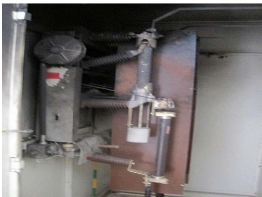
SECCIONADOR DE ENTRADA CALCINADO

Las imágenes muestran que estábamos frente a un siniestro de proporciones grandes, y cuyo valor de daños estaría en torno a los 700.000 €