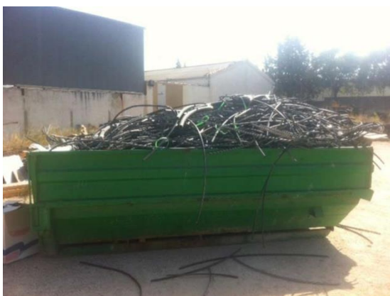
CONTENEDOR CON RESTOS DEL INCENDIO

Por lo tanto el conocimiento de la Correduría, junto con los trabajos de valoración efectuados por el perito del Asegurado son quienes a priori, ya habían determinado que de acuerdo a los valores de aseguramiento la cuantía del importe de la reparación debía ser indemnizada por la Compañía, lo que nos permitió con absoluta tranquilidad iniciar los trabajos de reparación, siempre respetando las condiciones del contrato y por lo tanto dejando todos los vestigios para su inspección y análisis por y para el perito de la Compañía.