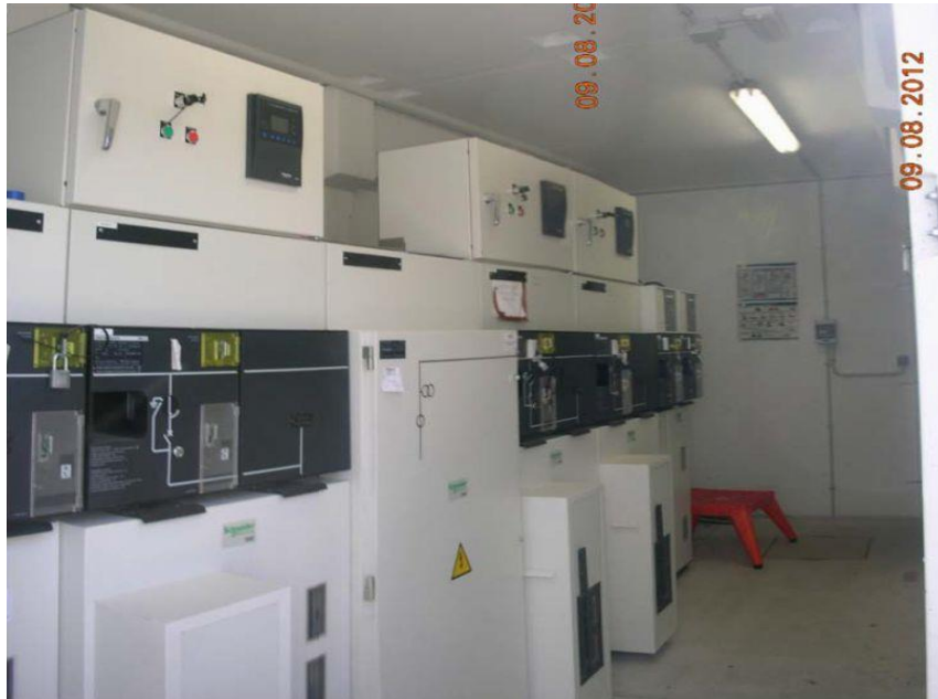
INTERIOR NUEVA CASETA Y EQUIPOS DE REPUESTO