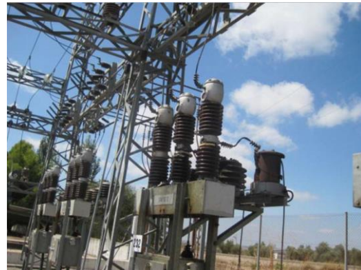
INTERRUPTOR 20 KV TRAFO-2, SECTOR II Y III