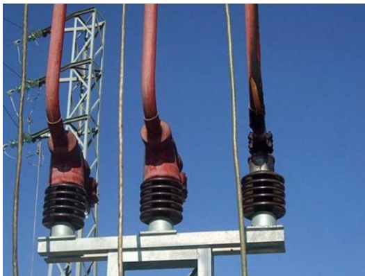
ENTRADA ENERGÍA EDE BARRAS 20 KV