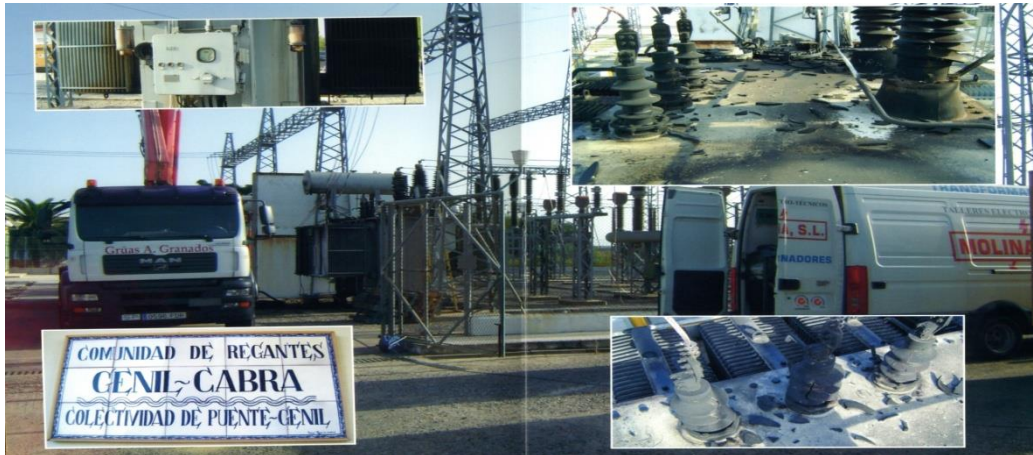
DESMONTAJE Y TRASLADO