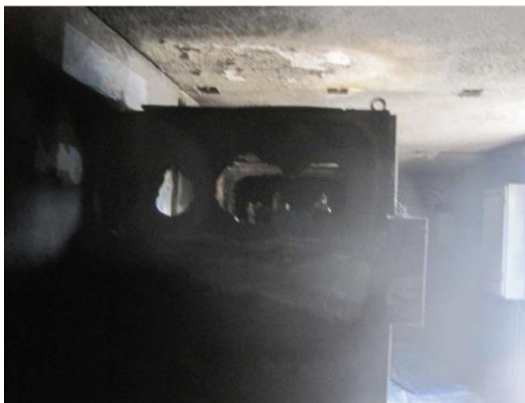
INTERIOR CASETA HORMIGÓN CALCINADA