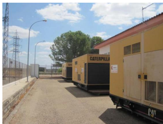
GRUPOS ELECTRÓGENOS PROVISIONALMENTE INSTALADOS

Toda esta labor inicial y previa que serán fundamentales para la solución del siniestro, que está basada tanto en la certeza de las coberturas de la póliza así como en cuáles son las obligaciones del Tomador/Asegurado para que la Compañía bajo ninguna circunstancia pueda denegar en parte o en todo, las consecuencias del siniestro y que implican decisiones como el envío del transformador al taller para ser reparado, sin esperar la actuación de la Compañía, son el protocolo de actuación de la Correduría EPG & Salinas, para con su asesoramiento y asistencia y siempre bajo las condiciones de la póliza contratada defender y salvaguardar los intereses de las Comunidades de Regantes