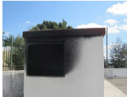
CASETA PREFABRICADA DE ALOJAMIENTO DE EQUIPOS. SAN JOSE