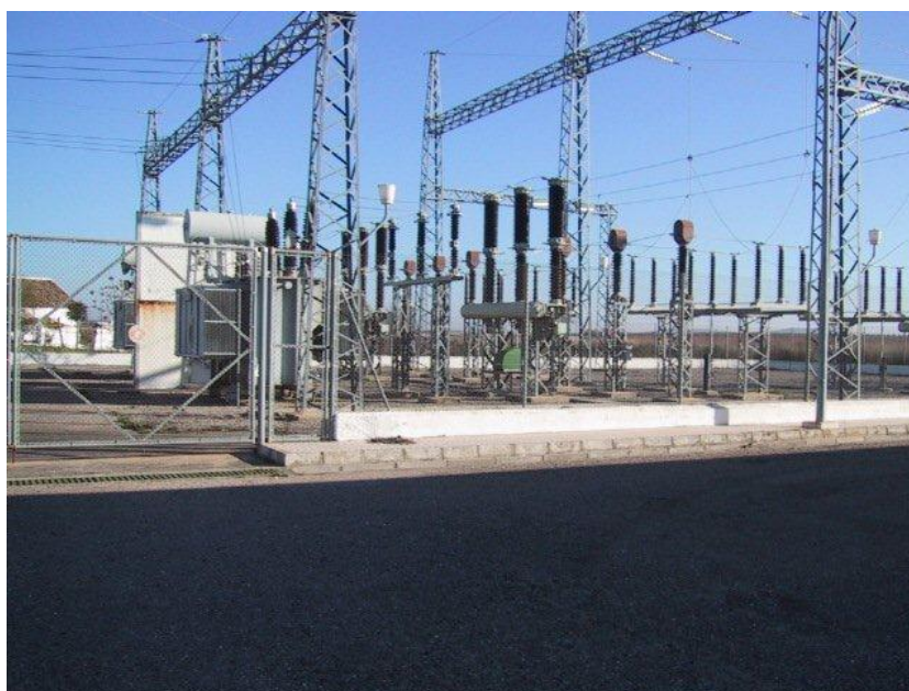
ESTACION DE PATA MULO

Desde este momento la Correduría, que conoce muy bien las instalaciones de la Comunidad de Regantes del Genil -Cabra, ya sabe que está frente a un siniestro de proporciones importantes y cuya solución requerirá el esfuerzo y colaboración de todos, dando inicio de inmediato al protocolo de actuación para estos casos. Protocolo que tras muchos años de experiencia en la resolución de siniestros de las Comunidades de Regantes, recoge un servicio total de asesoramiento aportando soluciones a todas las necesidades que se presentan durante el transcurso del siniestro y que no deja nada a la improvisación.