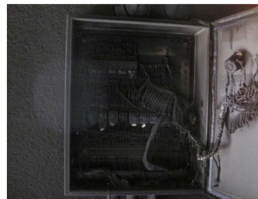
CUADRO DE CONEXIONES